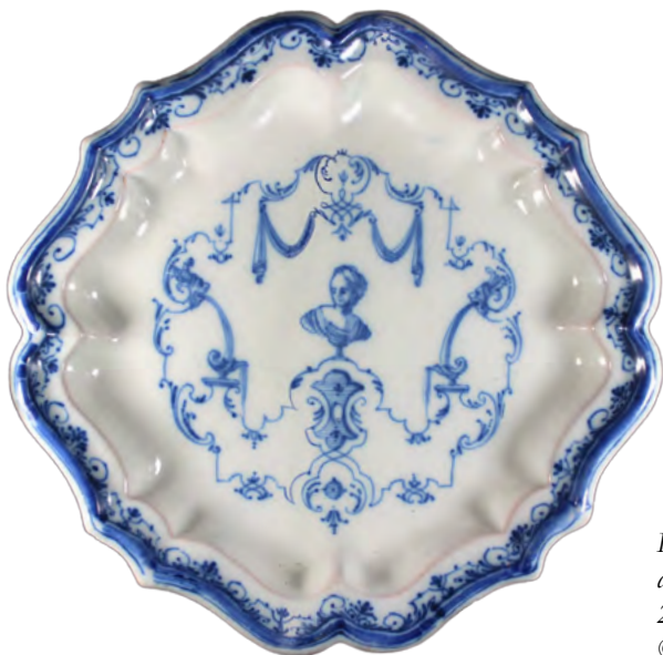
Plat à bord contourné, décor à la Bérain, Ø 24 cm, 2 e quart du XVIII e siècle.

Dans les deux premières parties, l'ouvrage retrace l'histoire de la collection et illustre la fabrication de la faïence au XVIII e siècle grâce au fonds archéologique issu des fouilles de la faïencerie du Bois d'Epense.